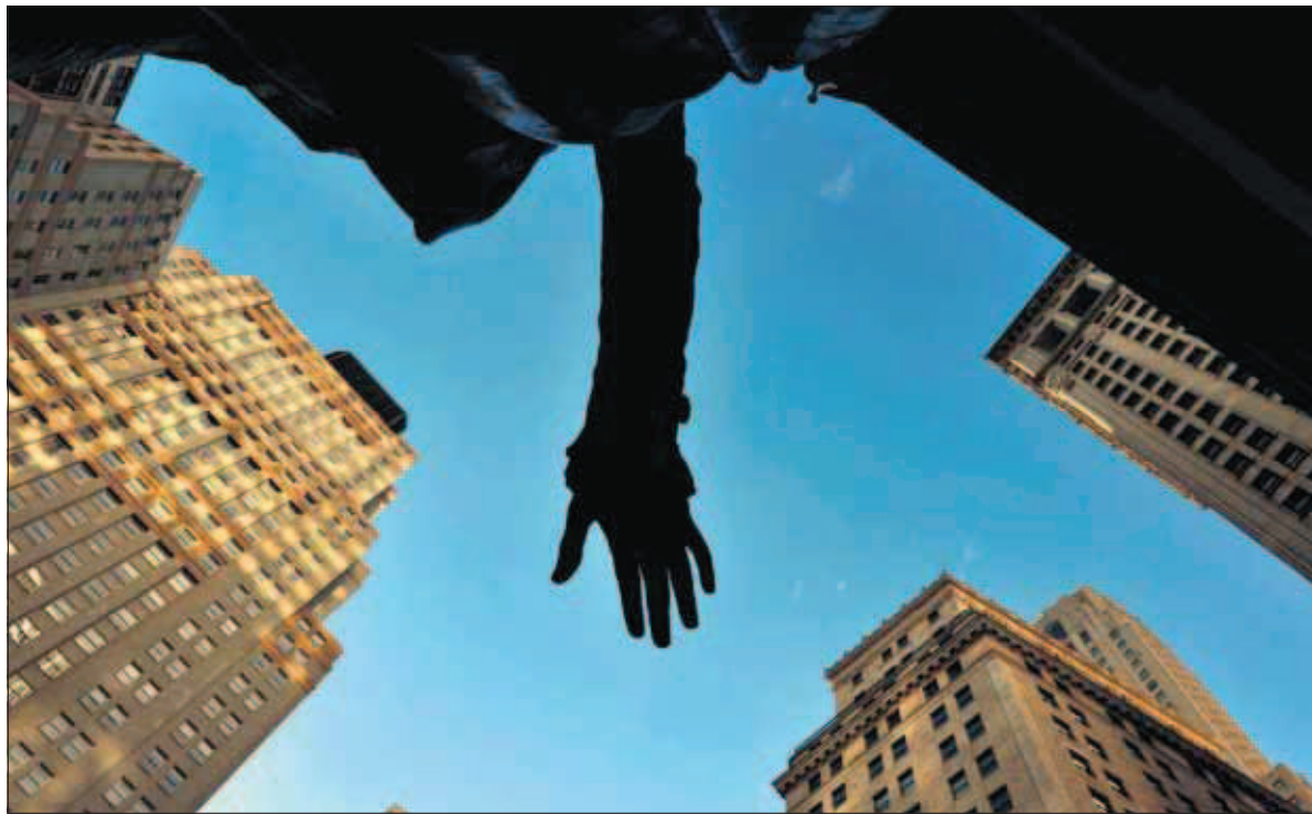
MARKEDETS BERØMTE HÅND: Ekspresident George Washington strekker ut en hånd foran børsen på Wall Street i New York.

Nyklassismen vokste fram på slutten av 1800-tallet, som et eksplisitt forsøk på å kopiere nye innsikter fra fysikk og energiteori over i økonomifaget. Resultatet ble en måte å tenke om økonomien på hvor verdi er noe som defineres av og oppstår under kjøp og salg. Shaikh ser dette som bakteppet for dagens finansialisering av